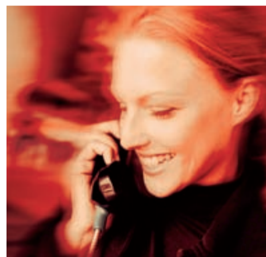
Rund um die Uhr für Sie im Einsatz.